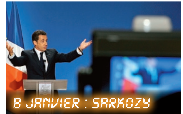
LA CONFÉRENCE DE PRESSE DU PRÉSIDENT : L'OCCASION POUR TFI D'Étudier D'ABORD "LE STYLE SARKOZY". POUR LE FOND, ON VERRA PLUS TARD.

Les médias ont toujours du mal à parler d'eux-mêmes. Ce 8 janvier, il était cependant difficile pour TF1 et France 2 de ne pas évoquer la mesure phare annoncée par le chef de