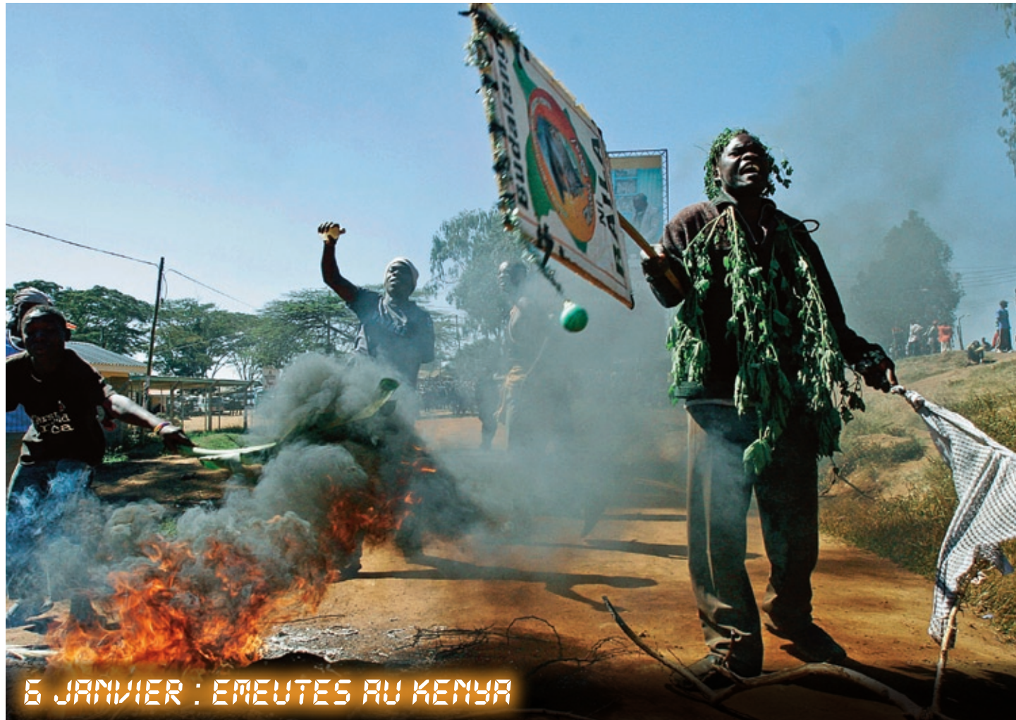
LES ÉMEUTES AU KENYA ONT ENTRAÎNÉ LE DÉPLACEMENT DE PLUS DE 100 000 PERSONNES, DIT FRANCE 2. À TFI, ON PARLE DE "TOUTE UNE POPULATION DÉPLACÉE."

venter un nouveau modèle. Pas simple. Il faudra sortir d'un formatage vieux de plusieurs décennies et modifier les habitudes de travail qui vont avec. Pas simple, non, mais nécessaire. Début janvier, nous avons passé une semaine devant les JT de 20 heures de TF1 et de France 2. Contrairement à l'idée reçue, ils ne se ressemblent pas tout à fait. Du moins dans le choix et la hiérarchie des sujets. Ils ont en revanche plusieurs points communs : on s'ennuie ferme à les regarder, le formatage de l'information y fait des ravages, on y croise les mêmes têtes, on s'y informe peu et parfois mal.